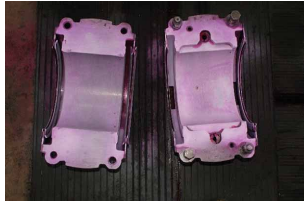
Rys. 4. Panewki generatora pokryte penetrantem barwnym