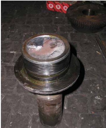
Rys. 2. Widok urwanego wału