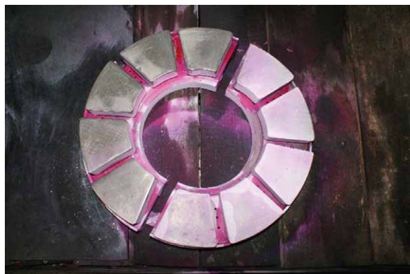
Rys. 6. Łożysko oporowe pokryte penetranem barwnym