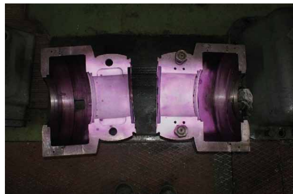
Rys. 5. Panewki turbiny pokryte penetrantem barwnym

wewnątrz elementów. Można je również stosować do szacowania zmian mikrostruktury materiału, powstających podczas długotrwałej eksploatacji oraz do pomiaru grubości obiektów. Główne dziedziny zastosowań to połączenia spawane, szyny kolejowe i tramwajowe, łopatki turbin i sprężarek, wyroby ceramiczne (izolatory).