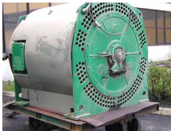
Rys. 1. Silnik indukcyjny dużej mocy z urwanym wałem od strony napędowej