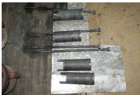
Rys. 7. Zawory grzybków regulacyjnych pokryte penetranem fluorescencyjnym