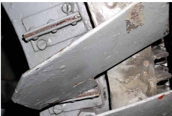
Rys. 3. Zerwanie łopatki wentylatora przymocowanego do korpusu wirnika [2, 3]