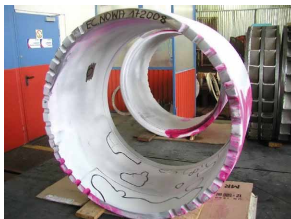
Rys. 9. Widoczne pęknięcia na powierzchni wewnętrznej kołpaka podczas badań penetacyjnych

Trzymając się tej zasady, w przypadku okresowych przeglądów turbozespołów wiele elementów generatora i turbiny bezwzględnie podlega badaniom nieniszczącym w celu stwierdzenia ich przydatności do dalszej eksploatacji. Badaniom takim poddawane zostają panewki generatora (rys. 4) i turbiny (rys. 5), łożysko oporowe (rys. 6), zawory grzybków regulacyjnych (rys. 7), śruby dwustronne – szpilki (rys. 8).