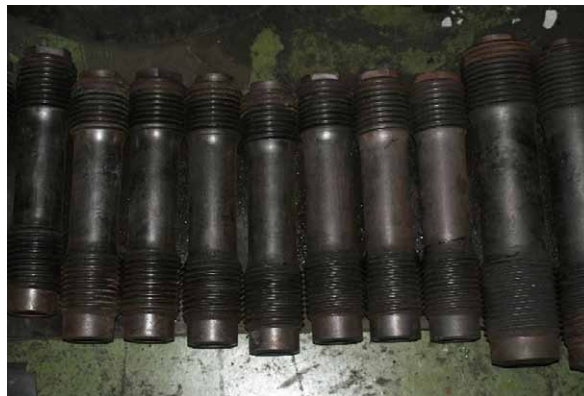
Rys. 8. Śruby dwustronne (szpilki) pokryte penetranem fluorescencyjnym