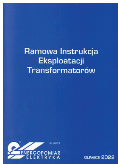
Rys. 1. Okładka RIET 2022

Ważne informacje dla eksploatacji zawiera rozdział 7, w którym w punkcie 7.1 opisano postępowanie w przypadku