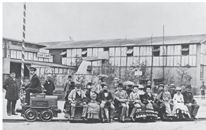
Rys. 1. Kolejka Wernera von Siemens wioząca pasażerów na terenie wystawy w Berlinie w 1879 roku.

Za pierwszy taki pojazd rozpoczynający nową erę w komunikacji masowej należy bezsprzecznie uznać małą lokomotywkę elektryczną Ernsta Wernera von Siemens zbudowaną w firmie Siemens&Halske w 1879 roku, zasilaną napięciem 150 V DC z tzw. trzeciej szyny, umieszczonej w torowisku, po którym się poruszała. Ciągnęła ona za sobą trzy małe wagoniki-ławki i woziła z dużym powodzeniem pasażerów wokół terenów wystawy powszechnej w Berlinie po zamkniętej trasie o długości ok. 300 metrów. Prowadzący lokomotywkę siedział na niej okrakiem, a pasażerowie w każdym wagoniku siedzieli w grupach po trzy osoby na dwóch ławkach zwróconych do siebie plecami – w sumie mogło ich być nawet 18. W następnym