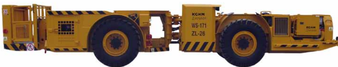
Rys. 1. Samojezdny wóz strzelniczy [3]

W samojezdnymi wozach strzelniczych (rys. 1) do napędu układu jezdnygo zastosowany jest wysokoprężny silnik spalinowy. Natomiast do napędu urządzeń technologicznych zabudowanych na tych wozach (tj. modułowego urządzenia pompowego służącego do wytwarzania i ładowania materiału wybuchowego do otworów strzałowych oraz układu podnoszenia kosza) stosowany jest silnik elektryczny, który napędza pompę hydrauliczną. Silnik elektryczny na napięcie znamionowe 500 V, zasilany za pośrednictwem przewodu elektrycznego. Każdorazowe rozwijanie oraz zwijanie przewodu zasilającego jest uciążliwe, czasochłonne oraz stwarza duże zagrożenie dla pracującej załogi wozu w rejonie przodka. Ponadto zdarza się, że po rozwinięciu i podłączeniu przewodu do rozdzielnicy występuje brak napięcia zasilającego w rozdzielnicy.