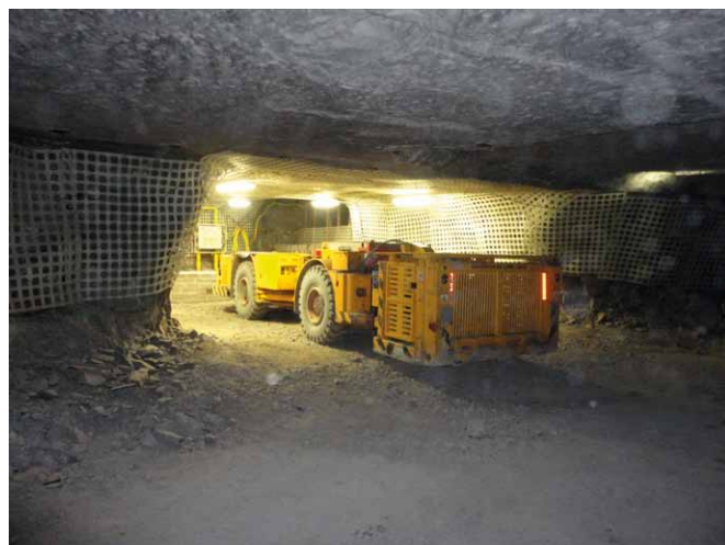
Rys. 9. Samojezdny wóz strzelniczy WS-172 podczas prób eksploatacyjnych w podziemiach kopalni rudy miedzi - ładowanie baterii[2]

zagrożenia dla środowiska i ludzi. W związku z powyższym ładowanie może odbywać się w dowolnym miejscu kopalni, bez konieczności stosowania specjalnie wentylowanych pomieszczeń, w których ładowana jest bateria.