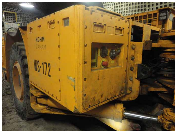
Rys. 2. Moduł baterii zabudowany na wozie strzelniczym [2]

nadzoru BMS (ang. Battery Management System ), falownik, wyłącznik główny, zasilacz 24 V oraz urządzenia kontrolno-zabezpieczające.