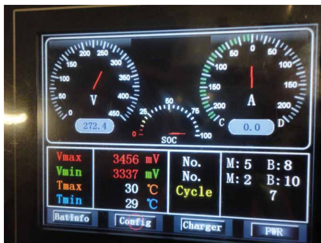
Rys. 10. Widok ekranu panelu diagnostyczno-serwisowego

Akumulatorowy zespół zasilania umożliwia pracę wozu bez dodatkowego czasu na niebezpieczną i uciążliwą czynność rozwijania i zwijania kilkudziesięciometrowego przewodu elektrycznego i jest gotowy do pracy od momentu dojazdu wozu do przodka. Zespół baterii jest monitorowany w czasie rzeczywistym. Podstawowe informacje, zarówno podczas pracy, jak i ładowania baterii wyświetlane są na panelu umieszczonym na obudowie modułu baterii, modułu ładowania oraz na pulpicie operatora wewnątrz kabiny wozu strzelniczego.