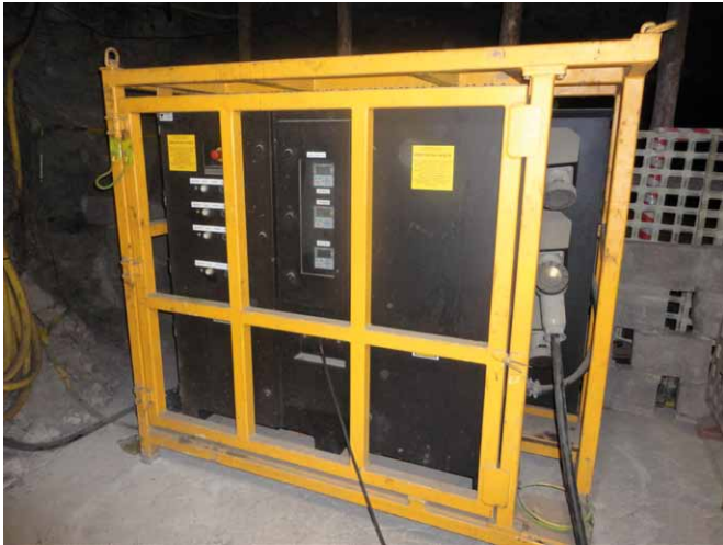
Rys. 5. Moduł ładowania [2]

2 godzin. Komunikacja modułu ładowania z systemem nadzoru BMS modułu baterii odbywa się poprzez magistralę CAN. Wyposażenie elektryczne modułu ładowania umieszczone jest w metalowej obudowie o stopniu ochrony IP56, zabezpieczonej antykorozyjnie. Chłodzenie modułu odbywa się w sposób pasywny (wewnątrz szafy umieszczono kilka wentylatorów w celu zapewnienia obiegu powietrza).