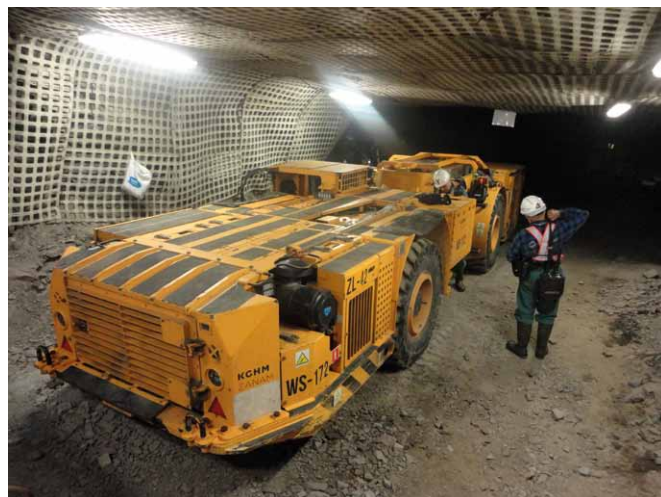
Rys. 8. Samojezdny wóz strzelniczy WS-172 podczas prób eksploatacyjnych w podziemiach kopalni rudy miedzi [2]