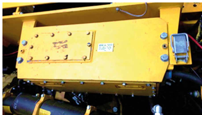
Rys. 3. Moduł aparatury zabudowany na wozie strzelniczym [2]

Moduł posiada trzy niezależne odpływy o mocy 20 kW. Umożliwiają one bezpieczne naładowanie trzech modułów baterii (rys. 2) o łącznej energii 96 kWh w czasie niespełna