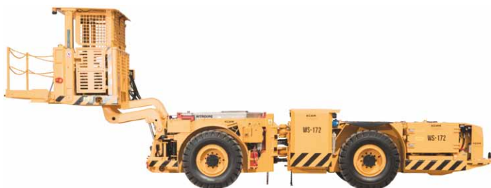
Rys. 7. Samojezdny wóz strzelniczy WS-172 [3]